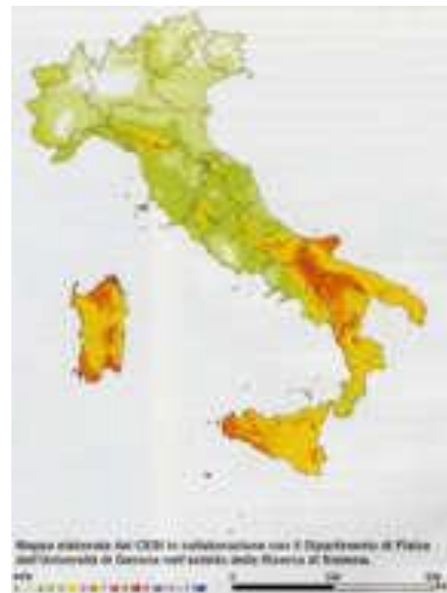
Mappa complessiva della velocità media del vento a 50 metri sul livello del mare.