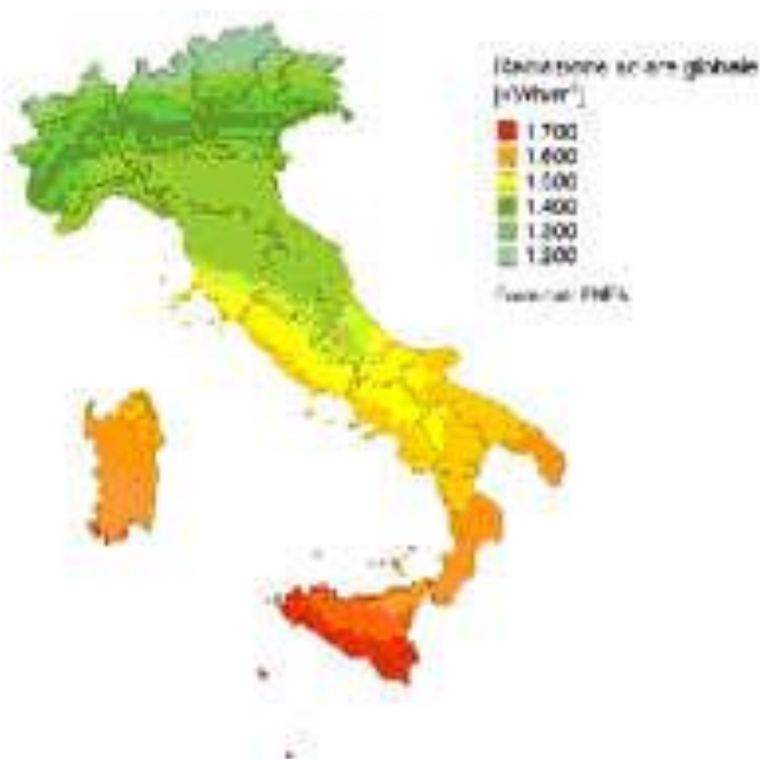
Mappa complessiva della irradiazione solare globale italiana